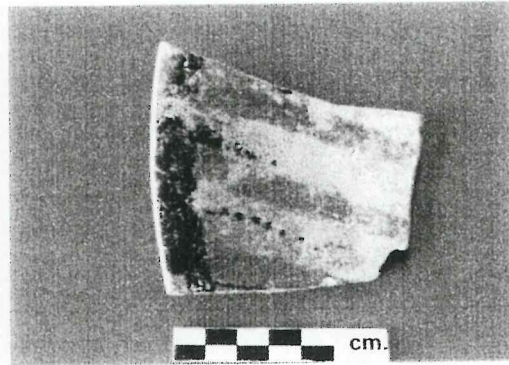
Fragmento de incensario con pastillaje e incisiones